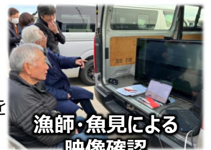
漁師・魚見による 映像確認