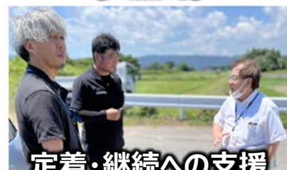
定着・継続への支援 (浪江町)