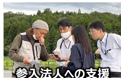
参入法人への支援 (大熊町)