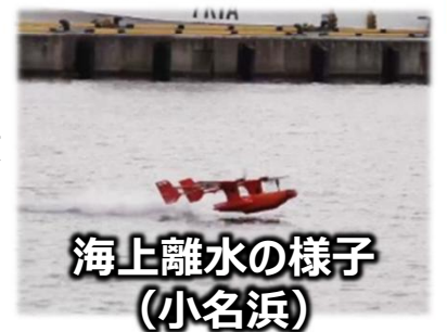
海上離水の様子 (小名浜)