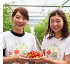
過足様(姉) 富塚様(妹)

皆様も「GREEN for TABLE」のラベルが貼られたミニトマトを食べて、笑顔でテーブルを囲んでみてはいかがでしょうか。相双機構では、販路拡大のお手伝いをさせていただき、今年の10月からは、近隣スーパーの地場産品コーナーで、ミニトマトが購入できるようにもなりました。