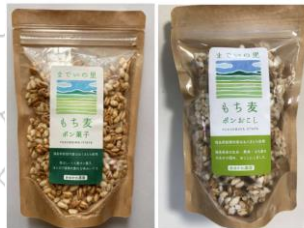
もち麦を加工したポン菓子