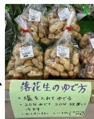
「おおまさり」の販売状況