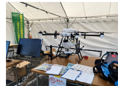
農薬散布用ドローン展示