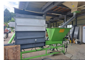
もみ殻連続炭化装置(スミちゃん)