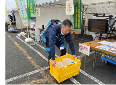
マッスルスーツの試着体験