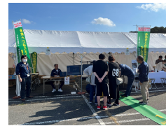
当日の機構ブース

相双機構では、これからもスマート農業の普及に向けて様々な取組を実施してまいります。