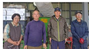
アンベファームの皆様

相双機構では、リース事業を活用した新たな機械導入のお手伝いをさせていただきました。