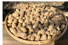
収穫した落花生「おおまさり」