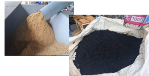
左) もみ殻、右) もみ殻燻炭