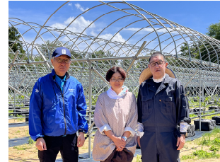
左から新妻事務局長、佐藤主任、小沼施設長