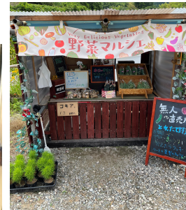
ご自宅前の直売所