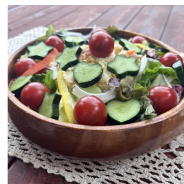
デコきゅうりを添えたサラダ