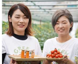
過足様(姉) 富塚様(妹)