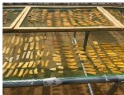
干しいも製造状況