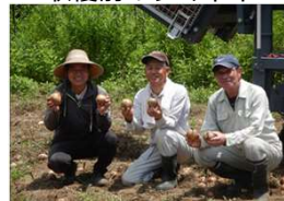
藤橋ファーマーズの皆様