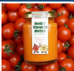
スイートトマトバター