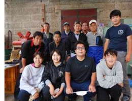
東京農業大学の学生と