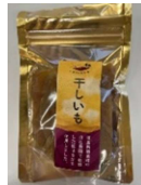
「いがりのおいも」ロゴマークと販売商品