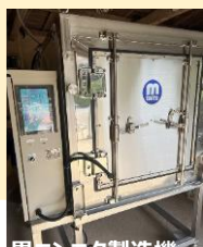
黒ニンニク製造機