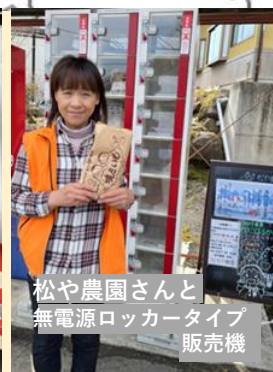
松や農園さんと 無電源ロッカータイプ 販売機