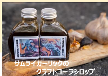
サムライガーリックの クラフトコーラシロップ