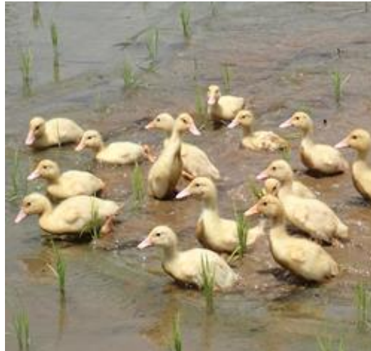
アヒルが駆け回る水田