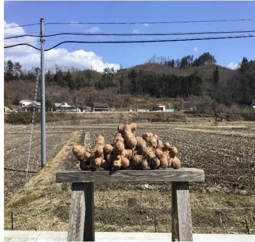
栽培されたキクイモ