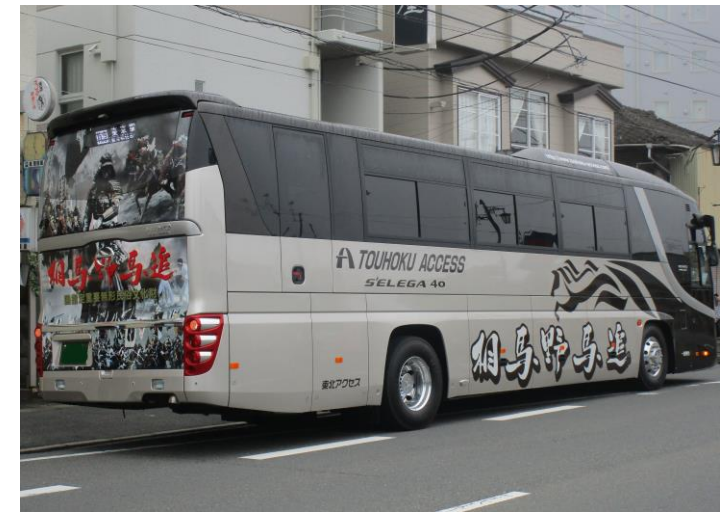
「相馬野馬追」ラッピングバス