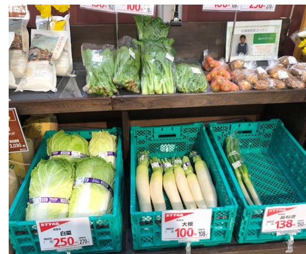
ブイチェーンネモト 地産地消コーナー