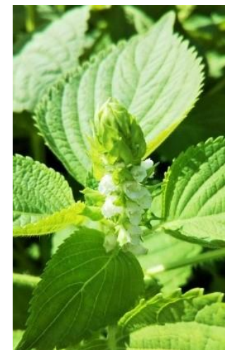
オーガニック栽培のエゴマ