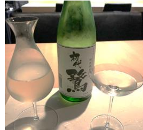
日本酒「初代 鶯(あひる)」