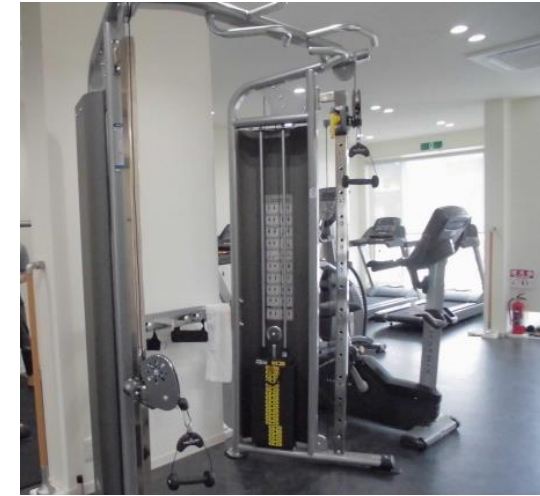
トレーニングマシン