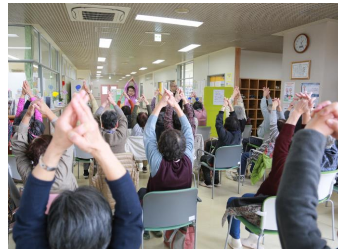
認知症予防プログラムの一コマ