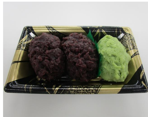
評判の高いふるうちのおはぎ