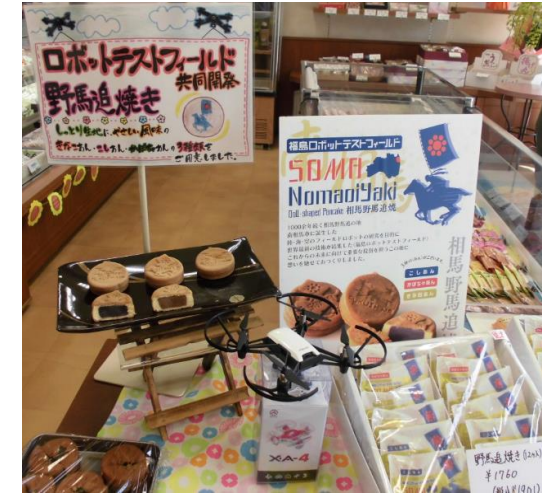
新商品の「野馬追焼き」