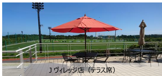
Jヴィレッジ店 (テラス席)