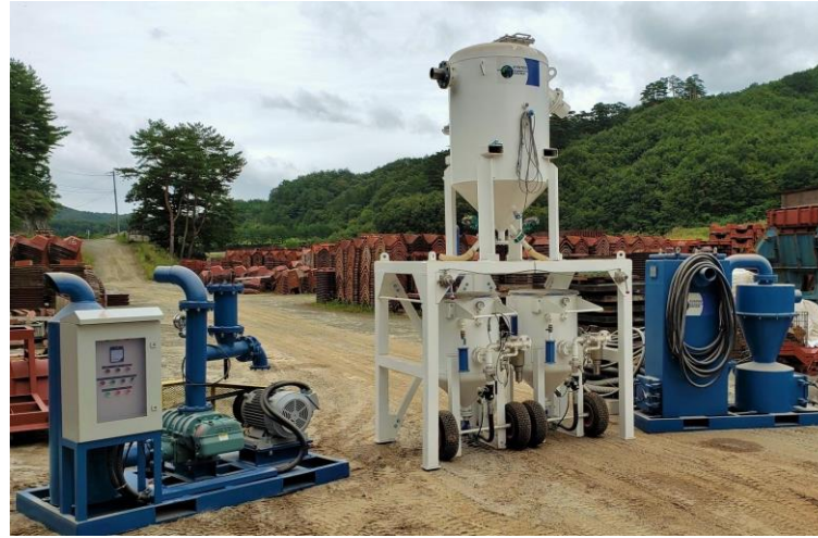
移動可能な循環式ブラスト機