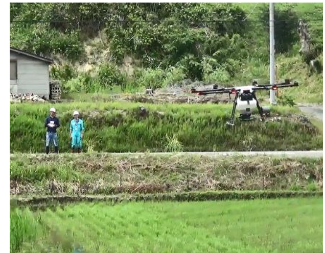
農業用ドローンによる 除草剤散布作業