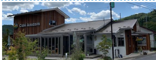
川内店ガーデンモニュメント (建築家、隈研吾氏監修)