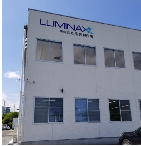
榎葉南工業団地の新工場