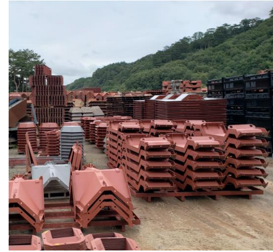
メンテナンスされた鋼材