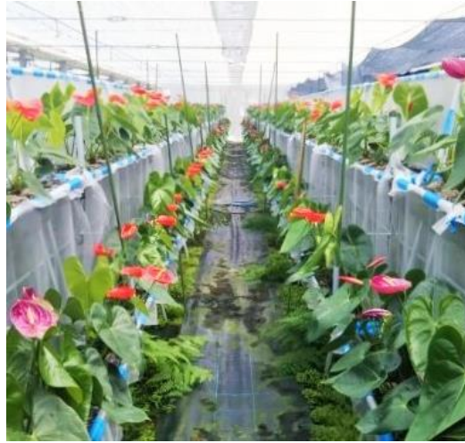
栽培中のアンズリウム