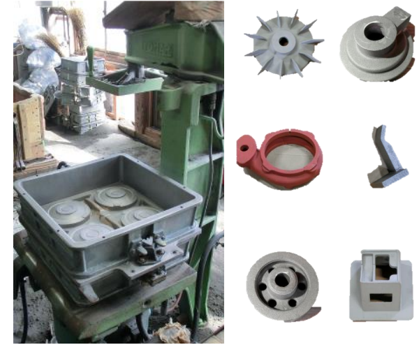
F1型鑄造機と鑄造品