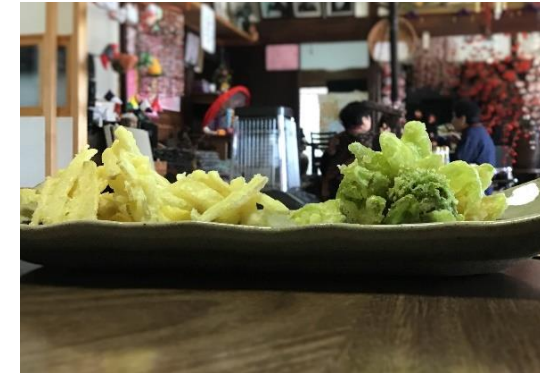
キクイモの天ぷら