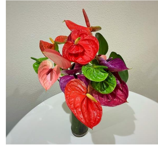
色鮮やかなアンズリウム