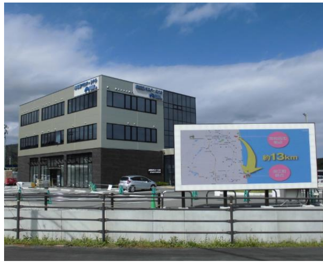
本社・南相馬バスターミナル