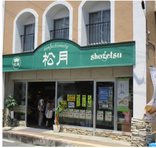
再開した小高本店