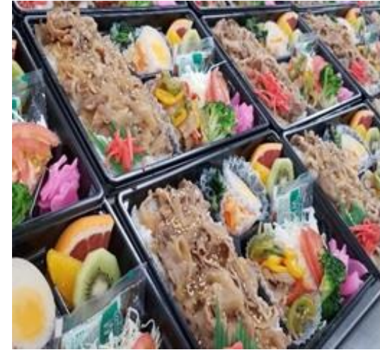
まごころのこもったお弁当