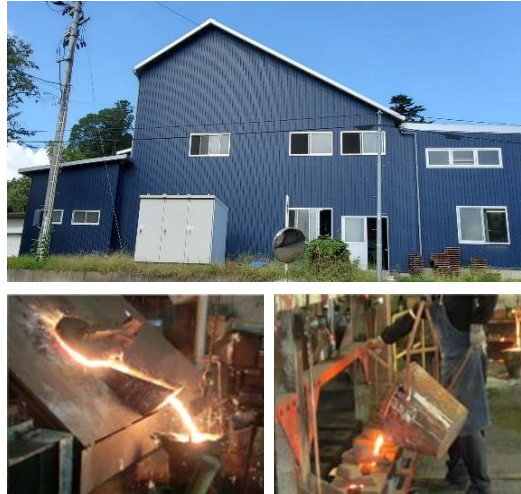
写真上：工場外観（再建後） 写真下：工場内部