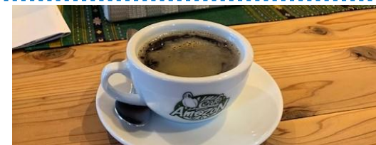
タイから直輸入されたコーヒー豆を使用