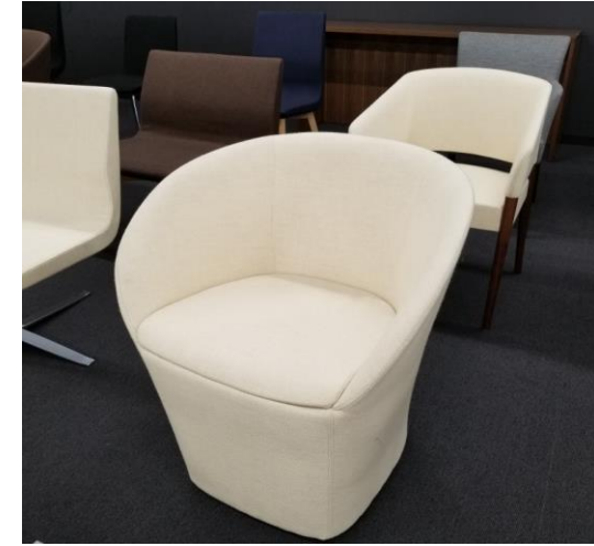
スタイリッシュな家具