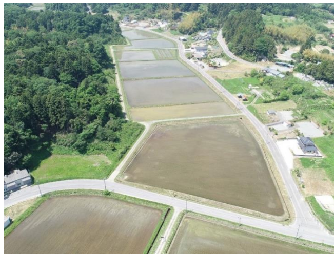
紅梅夢ファームのほ場風景