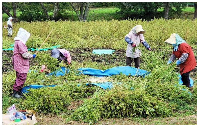
エゴマの収穫作業