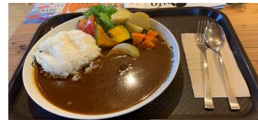
コーヒーとオリジナルカレー