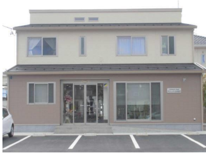
フィットネスクラブ(1階)