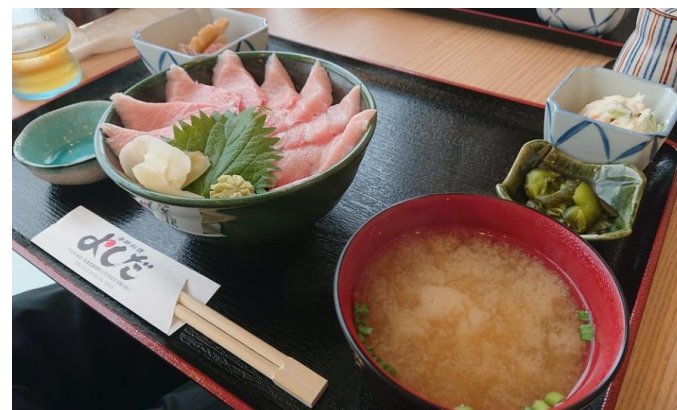
おすすめの本マグロ丼