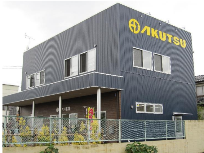
浪江町の新たな店舗