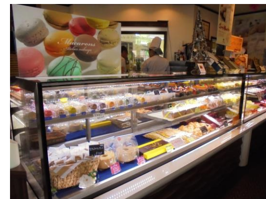
ショーケースに並ぶスイーツ