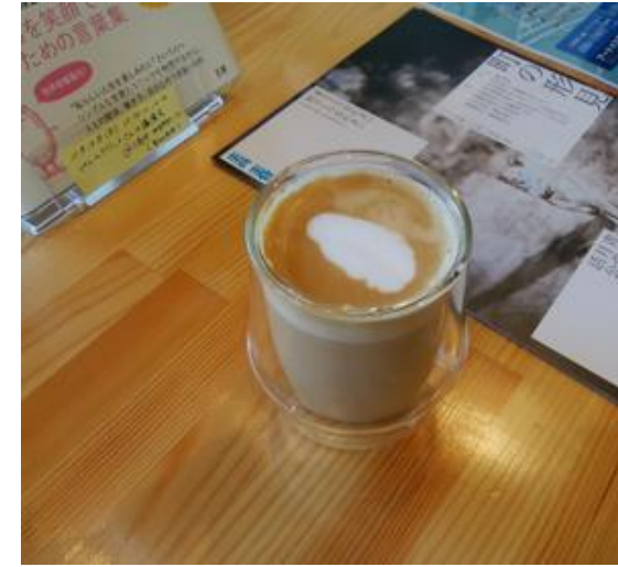
こだわりのスペシャルティコーヒー