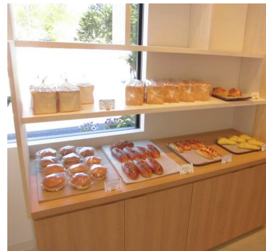
人気の食パンが並ぶコーナー