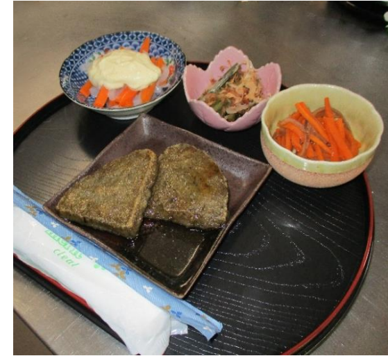
週替わりランチメニュー