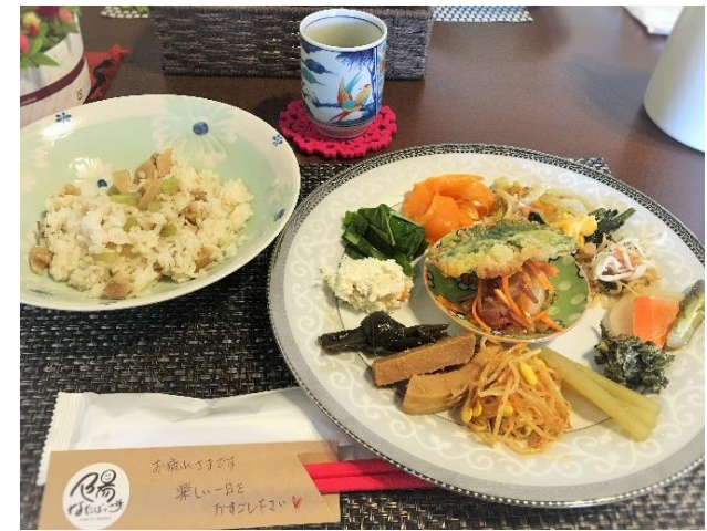
和漢膳料理のランチメニュー