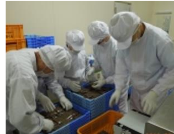
こんにゃく製造の様子