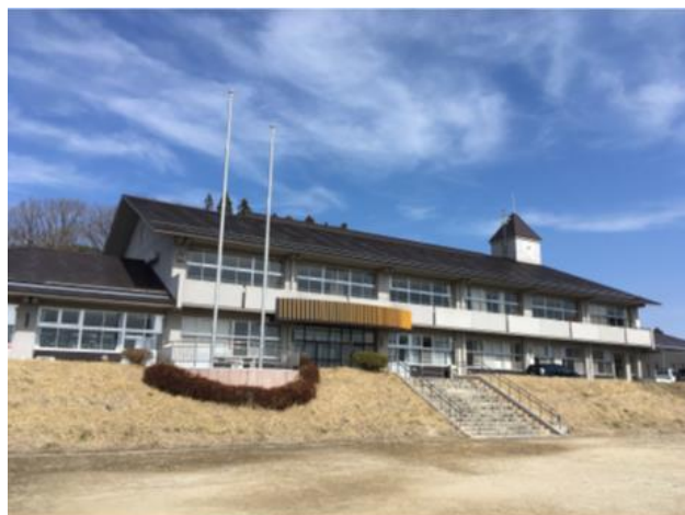
「テラス石森」(旧石森小学校)