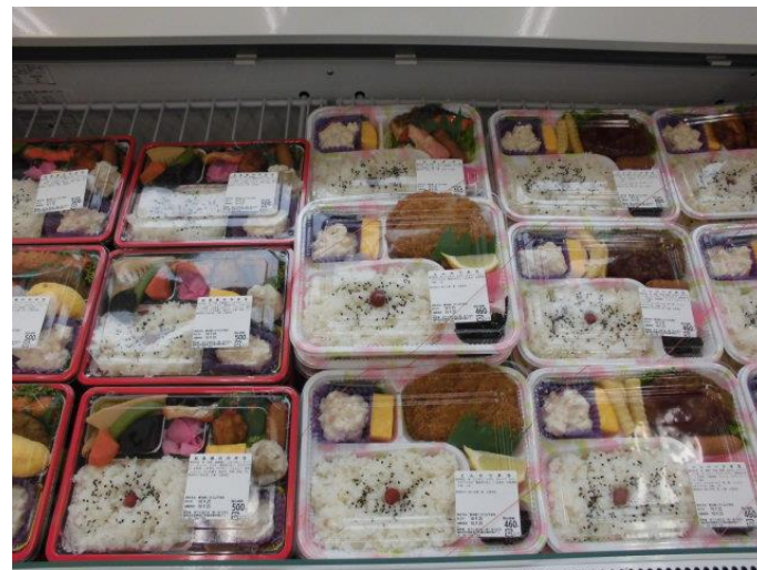
バラエティ豊かなお弁当