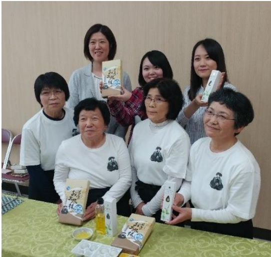
商品お披露目会の様子