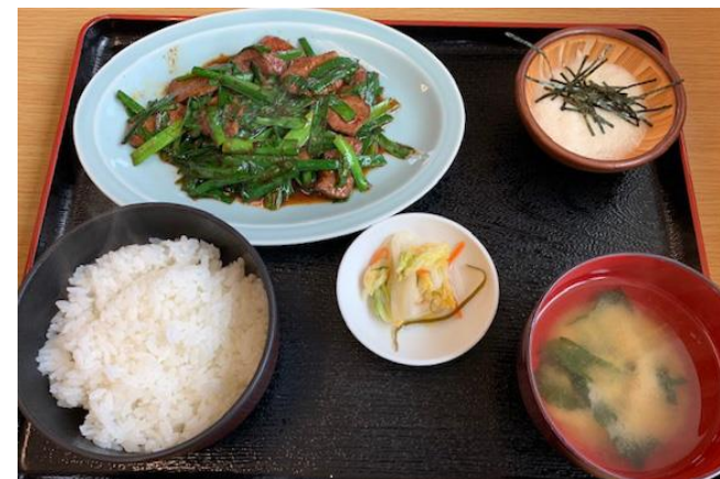
看板メニューの「ニラレバ炒め定食」