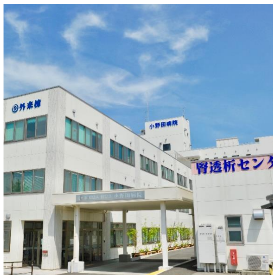
外来棟及び腎透析センター外観