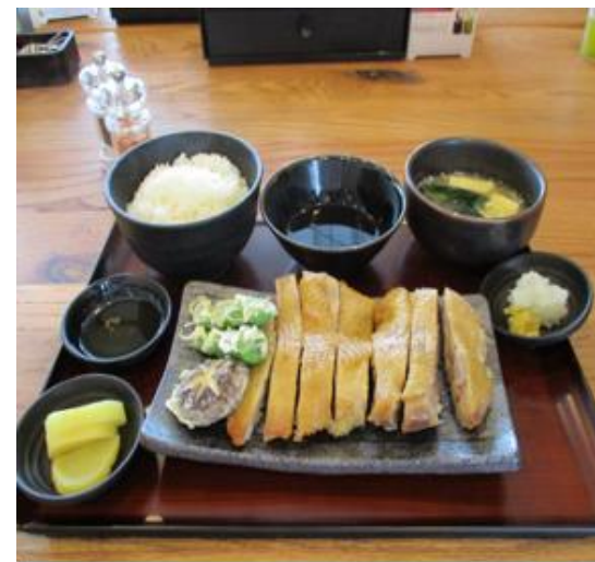
人気のローストチキン定食