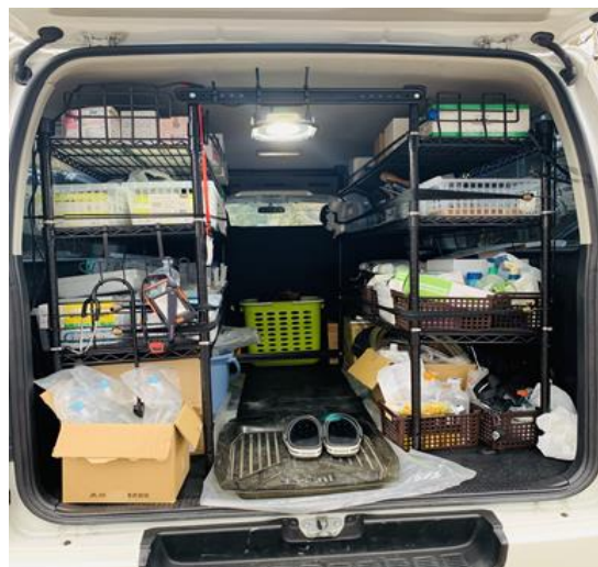
車両に装備した医療機器