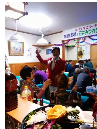
クリスマス会での一コマ