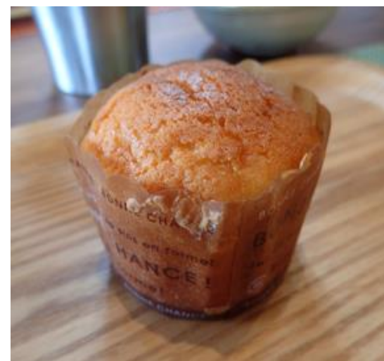
キウイを使ったマフィン