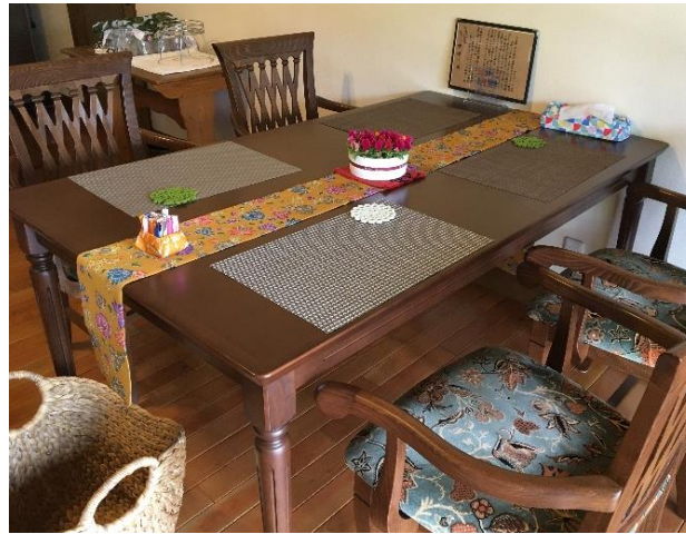
落ち着いた雰囲気店内