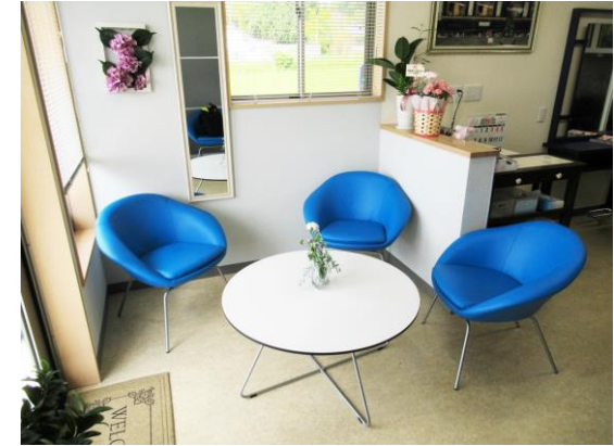
店内の交流スペース