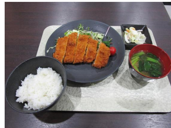
地元産の前田ポークを使った 「とんかつ定食」