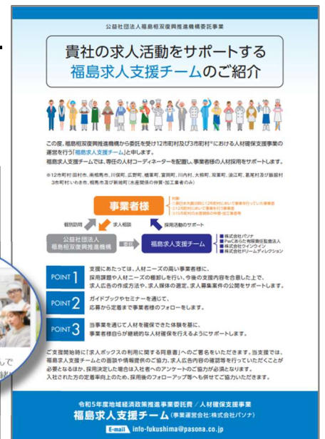
求人活動のパンフレット

※求人ボックス： https://xn--pckua2a7gp15o89zb.com/