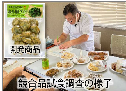
競合品試食調査の様子

「常磐もの」を使い、消費者の嗜好トレンドを踏まえた新商品企画や味付け、パッケージ作成等の支援を実施し、新商品の開発に繋がりました。