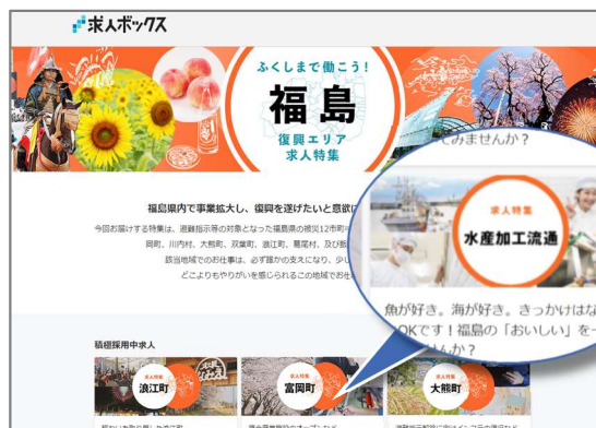
福島県専用求人ホームページ例

加工業務を中心に14事業者で59名の採用マッチングを実現しました。 ※2023年6月時点